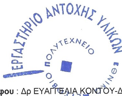
Δρ Β. ΒΑΔΑΛΟΥΚΑ

Υπεύθυνος Αναθεώρησης Εγγράφου : Δρ ΕΥΑΓΓΕΛΙΑ ΚΟΝΤΟΥ-ΔΡΟΥΓΚΑ