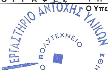
Ευαγγελία Κοντού Δρούγκα Καθηγήτρια ΕΜΠ

Υπεύθυνος Έκδοσης : Δρ Β. ΒΑΔΑΛΟΥΚΑ ΗΜΕΡΟΜΗΝΙΑ ΕΚΔΟΣΗΣ : 3 Μαρτίου 2015